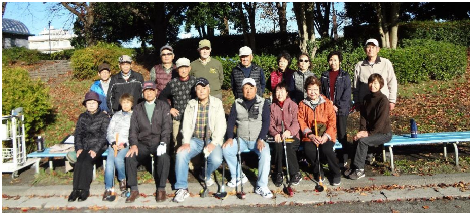
(文：1班 佐生 健二)