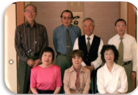
卒業式後の懐かしい写真

2組の3人打ちで実施することもあります。1年半になりますが、皆さんの知識も向上し点数の教え方以外は何とか打てる格好になってきました。麻雀は頭の体操と指先の運動を兼ね備えた高齢者認知予防の1つにも挙げられております。今後も可能な限り継続出来ればと考えております。