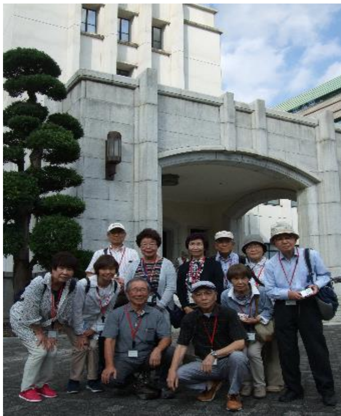
防衛省玄関前にて

令和2年度以降の活動については、現会員の希望として今までのような活動を続けて欲しいとの声が多くあり、今後の新しい運営体制を4月中にも決定し活動を続ける予定です。