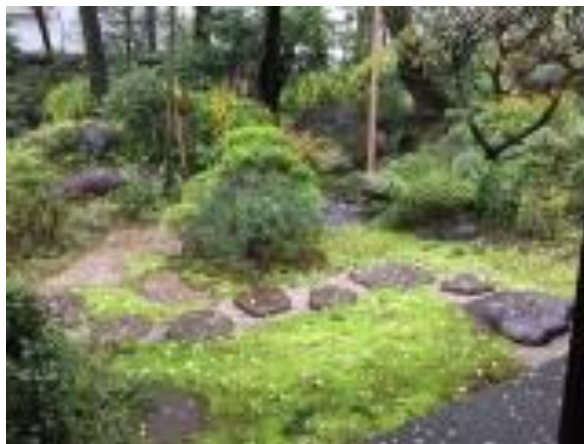
横山大観記念館庭園